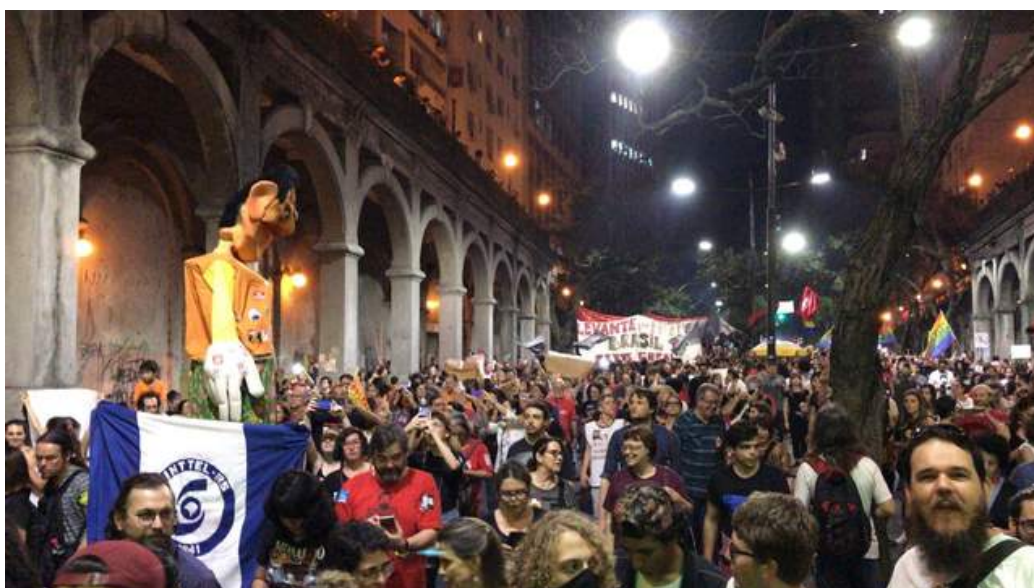
FIGURE 3 – Manifestation contre Bolsonaro à Porto Alegre, 14 juin 2019