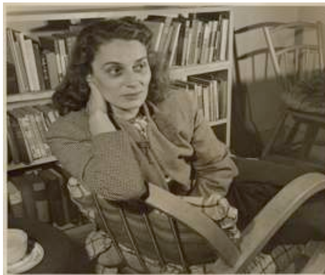
Gabrielle Roy en 1946.

L'exposition de Bibliothèque et Archives Canada a présenté un total de cent quarante pièces (manuscrits, objets, photos), orientées d'abord autour du parcours biographique de l'écrivaine, depuis son enfance à Saint-Boniface jusqu'à sa carrière de journaliste-pigiste pour des journaux et revues montréalais au tournant des années 1940, puis de la parution de son plus grand succès, Bonheur d'occasion , en mettant surtout l'accent, en dernier lieu, sur la part autobiographique de l'œuvre ( Rue Deschambault , La Route d'Altamont , Ces enfants de ma vie et La Détresse et l'Enchantement ). Exploitant non seulement l'écrit, mais aussi les matériaux visuels et sonores, l'exposition a également mis en valeur certaines éditions de luxe des œuvres royennes ainsi que des tableaux d'artistes – comme ceux du peintre Jean-Paul Lemieux – ayant illustré quelques-uns de ses romans.