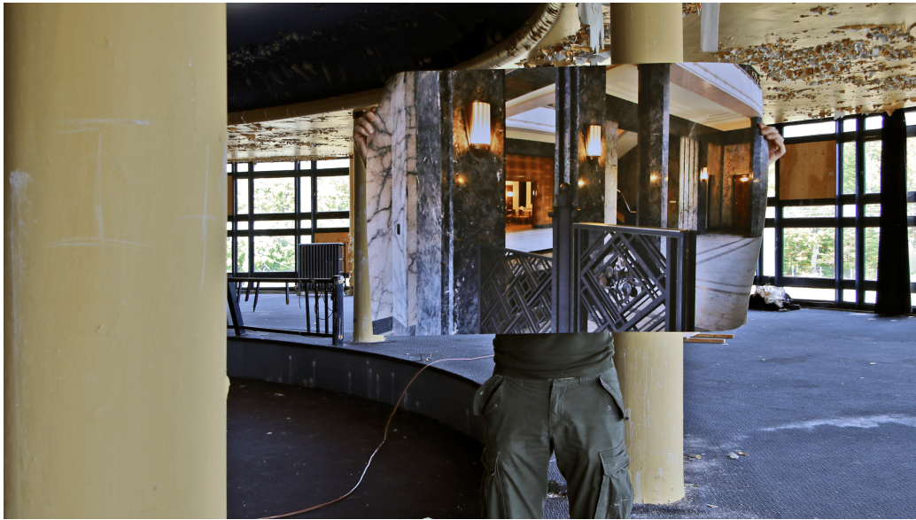
FIGURE 10 – Bruno Goosse, « Polak chez Courtens » impression numérique, 2019.