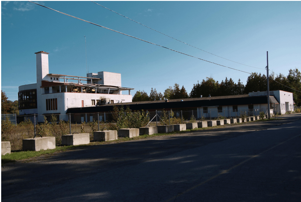
FIGURE 1 – Community center, 2018, photo de l’auteur.