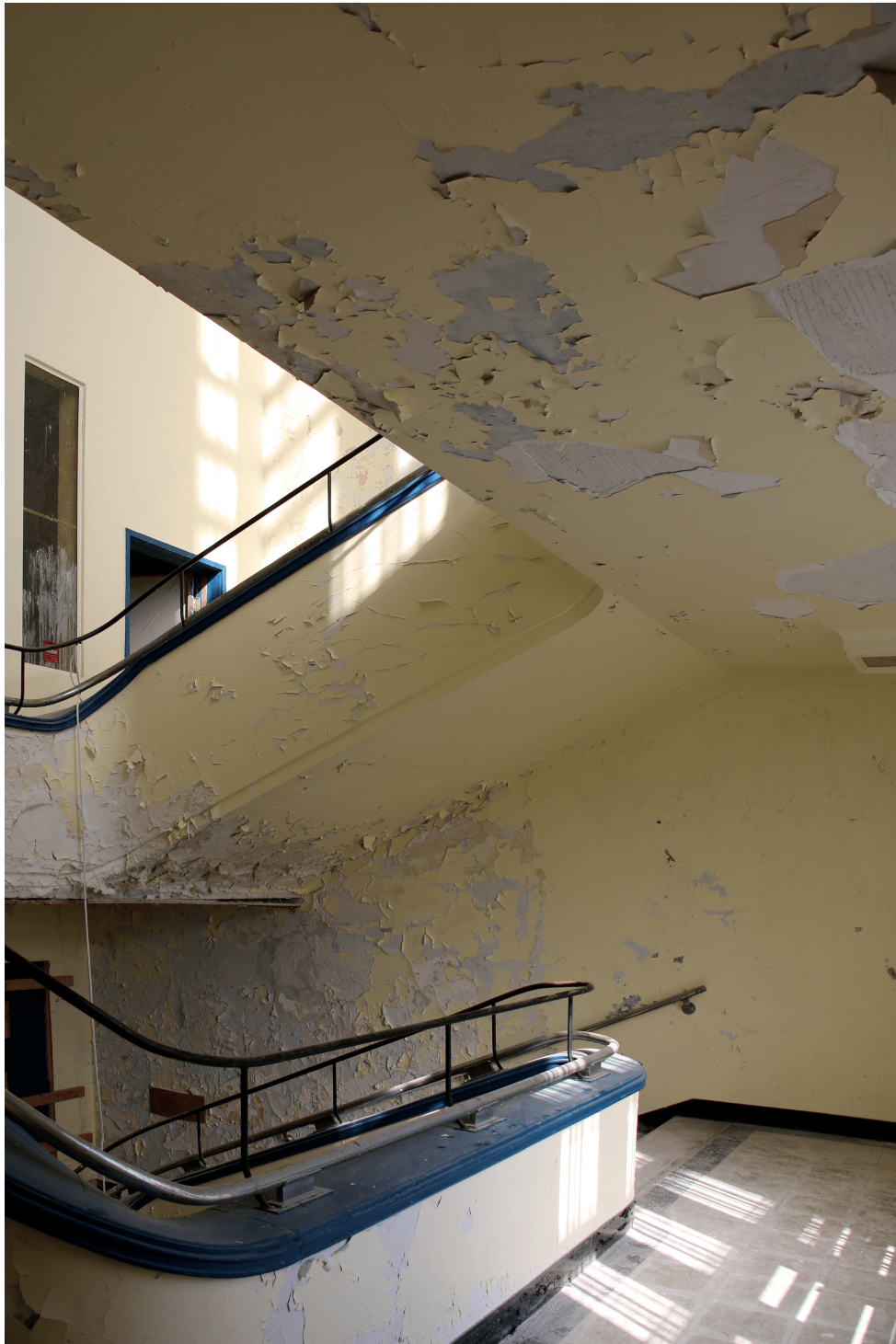
FIGURE 5 – Cage d’escalier du Community center, 2019, photo de l’auteur.