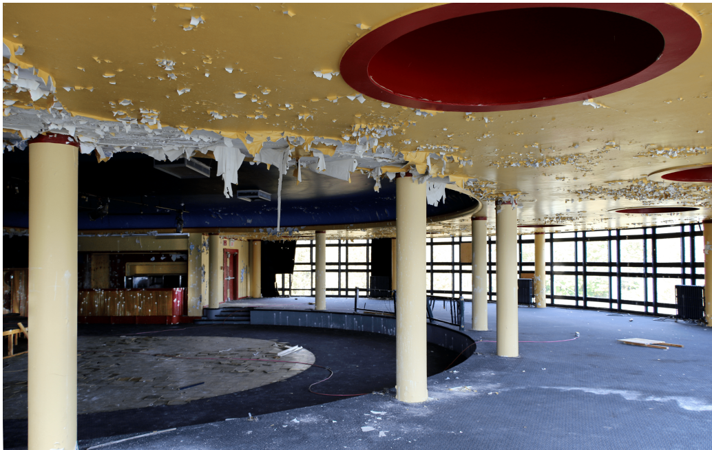
FIGURE 8 – Blue room du Community center, 2019.

Cette action judiciaire, si elle était perdue par la Ville aurait coûté très cher aux citoyens. Face au risque de l'augmentation des taxes, nombreux étaient les citoyens qui se sentaient moins concernés par la sauvegarde de leur patrimoine. Il fallut faire marche arrière, retirer la citation municipale. Ce qui ne mis malheureusement pas fin à l'action judiciaire à l'encontre de la Ville. J'ai beaucoup travaillé avec le promoteur et je pense pouvoir dire avoir gagné sa confiance. Nous cherchions une solution respectant ce patrimoine exceptionnel. Mais en 2017, je n'ai pas été reconduit comme je l'espérais à la Mairie de Saint-Marguerite-du Lac-Masson. La situation est bloquée. Le bâtiment est vide depuis 5 ans. Mais, le combat pour la sauvegarde du Centre culturel n'est pas terminé.