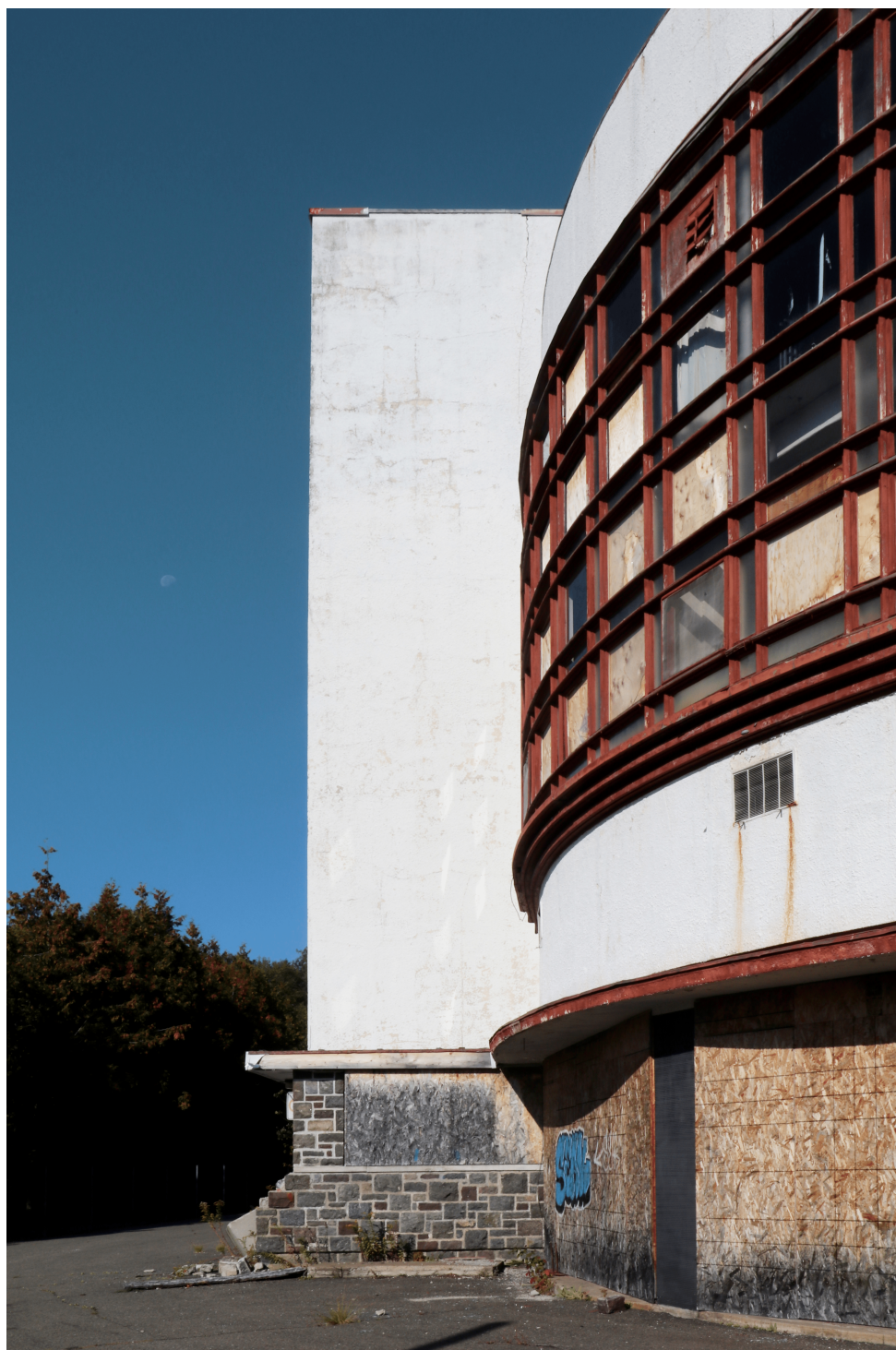
FIGURE 4 – Community center, 2019, photo de l'auteur.