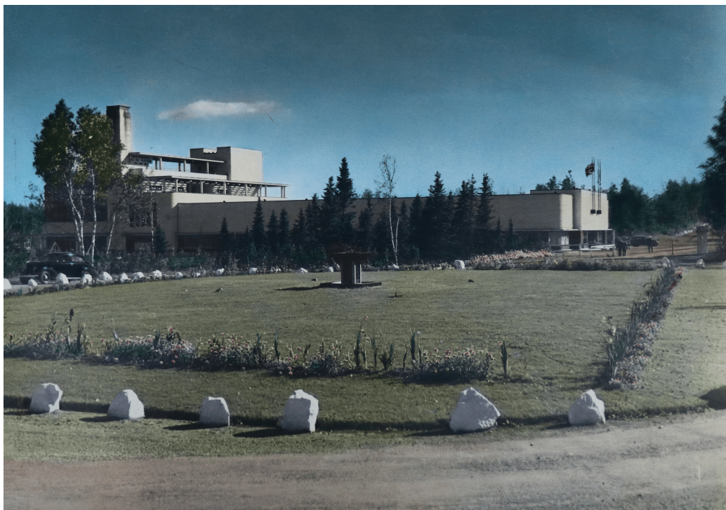
FIGURE 2 – Community center, photo noir et blanc colorisée, de Joseph et Édouard Comellas, 1938 (archives de la Société d’Histoire de Sainte-Marguerite-du-Lac-Masson et D’Estérel)