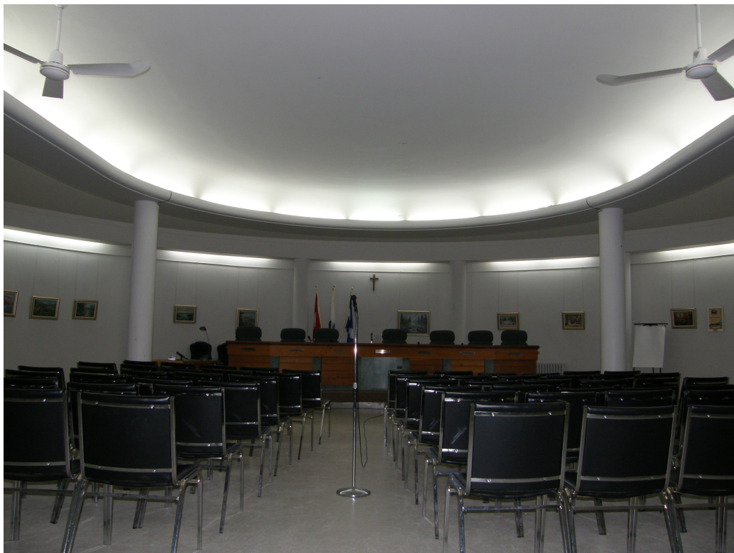
FIGURE 3 – La salle du Conseil dans l'ancien cinéma du Community center, photographie anonyme, 2014 (archives de la municipalité de Sainte-Marguerite-du-Lac-Masson).

La région était pauvre, mais bénéficiait d'une richesse dont les villes ne pouvaient se prévaloir : la pureté de l'air. C'est ce qui a retenu le baron Empain.