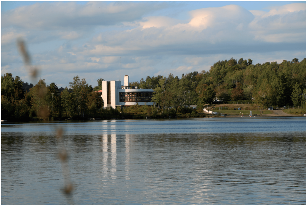
FIGURE 9 – Community center, 2018.

Concevoir un projet comme celui-là c'est d'abord, pour celui qui s'y emploie, être porté par l'enthousiasme. Confronté à de multiples frustrations, dont le classement est ici un élément déterminant, l'enthousiasme laisse la place à la déception. Peu importe ce qu'il adviendra maintenant. L'enthousiasme ne reviendra plus.