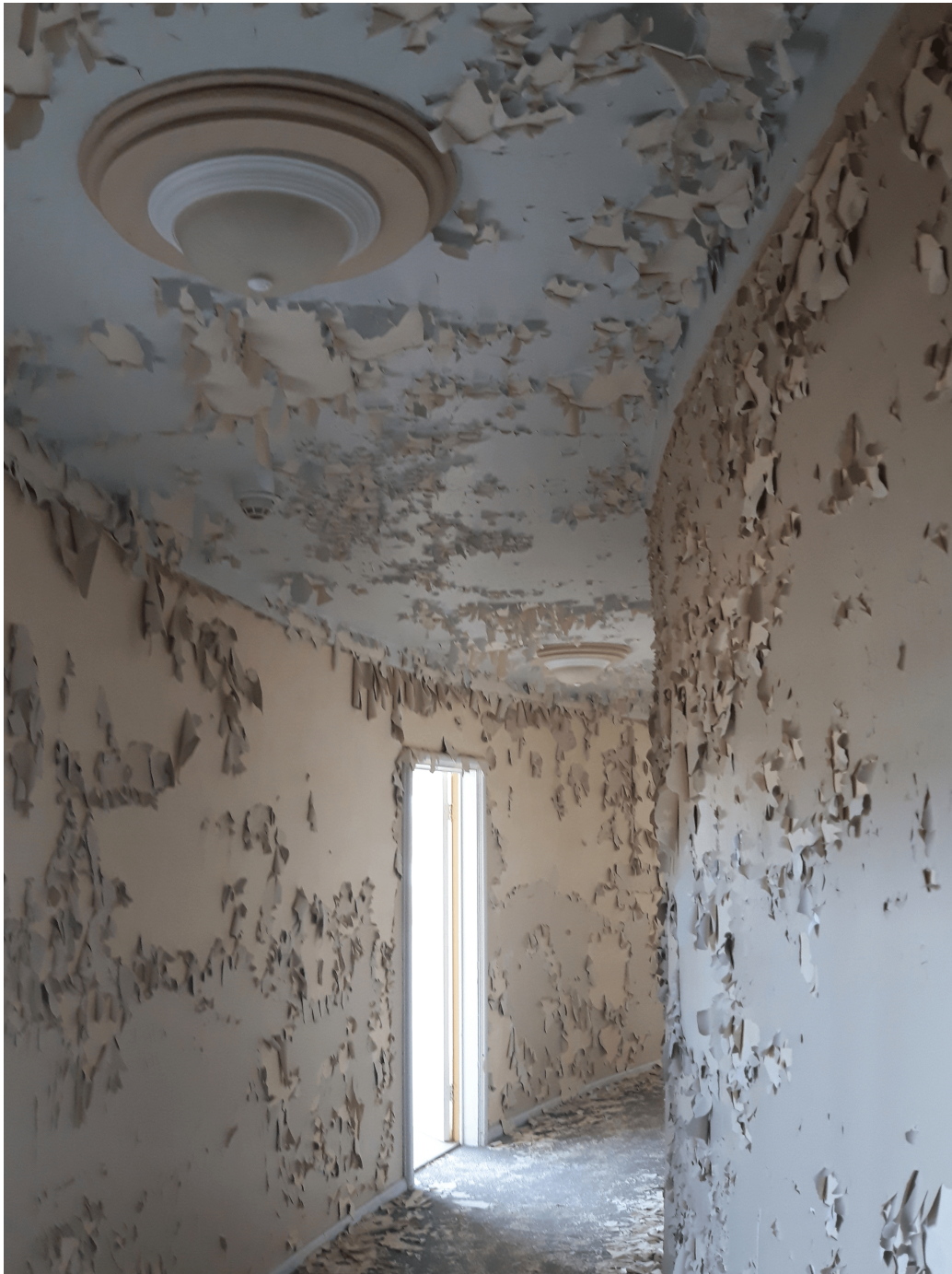
FIGURE 7 – Community center, 2019, photo de l’auteur.