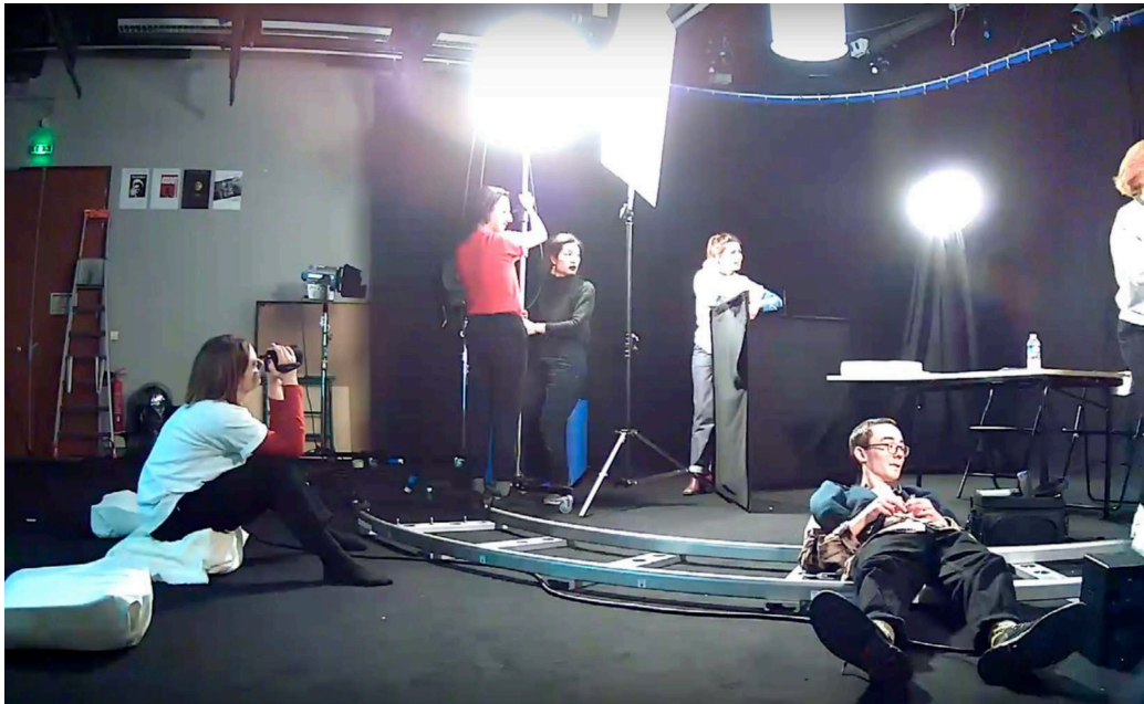
FIGURE 1 – Image de cam ra de surveillance ( Lil'Sister ), installation et tournage d'un non-film