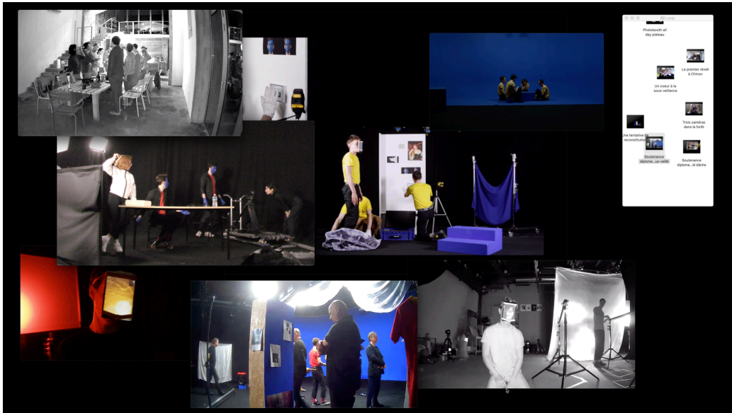
FIGURE 4 – Capture d' cran d'un montage loop  , d cembre 2018

sur un m me  cran d'ordinateur, retransmis en direct   l'aide d'une vid o-projection. Plusieurs  l ments sont ainsi ouverts et juxtapos s, avec ou sans leur son : images fixes, vid o, textes sont alors offerts en m me temps   la vue. Rapproch s, en plus ou moins grande taille et nombre, ceux-ci sont mis en rapport dans un seul cadre – celui de l'ordinateur –, projet  directement   l'aide d'un vid o-projecteur, en mode recopie d' cran . Cela forme un atlas mouvant et organique. La sp cificit  de cette monstration r side dans l'impr visibilit  et la spontan it  de mise en animation des  l ments. En effet, une pr -s lection est r alis e en amont et en fonction de l'occasion mais le surgissement des vid os est mis en jeu en direct ,   travers le choix sur le moment du monteur-performeur.