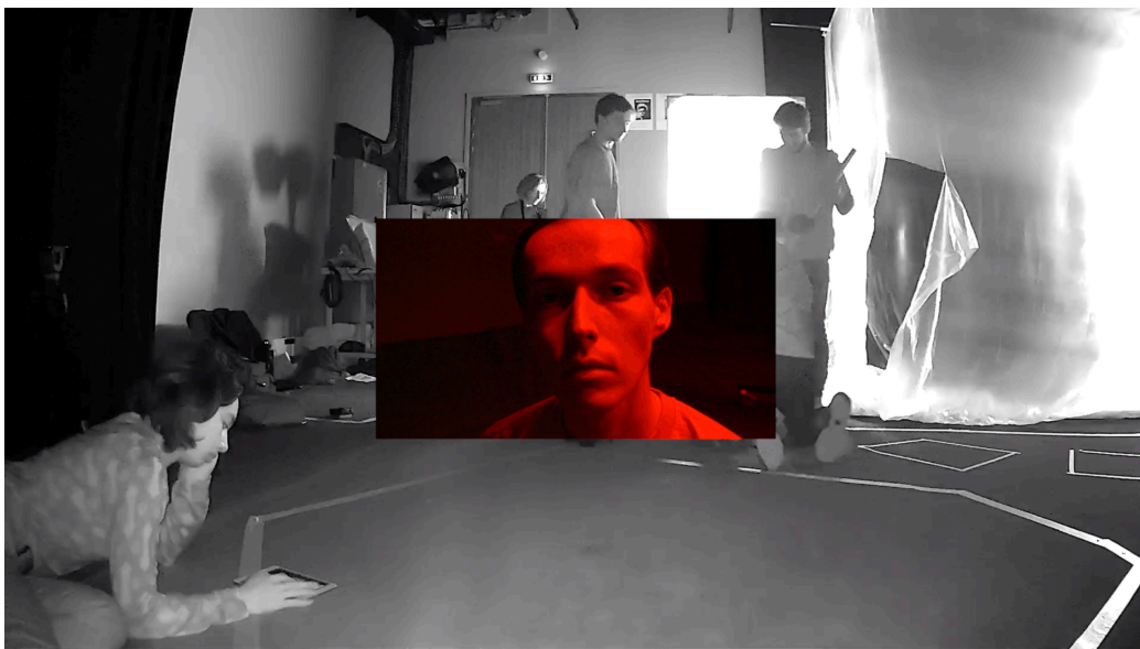
FIGURE 5 – Connection Lost, 10 minutes 17 secondes.

Cette pratique du montage loop  a  t  cristallis e dans une proposition parall le nomm e Connection Lost (2019) 20 . Si la dimension du risque et de l'impr visibilit  ne caract rise plus cet essai, c'est parce que l'intensit  de la mise en relation des  l ments entre eux a  t  le fruit d'une longue accumulation d'exp riences et de tentatives. Connection Lost est une autre piste, tentative relativement œuvr e – car en une forme fixe – de la plupart des  v nements DODJ qui sont r agenc s et ce, dans un exc s de l'hyperdiffusion,