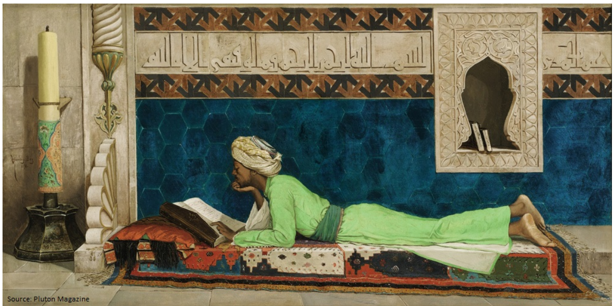
FIGURE 1 : Source : Pluton Magazine