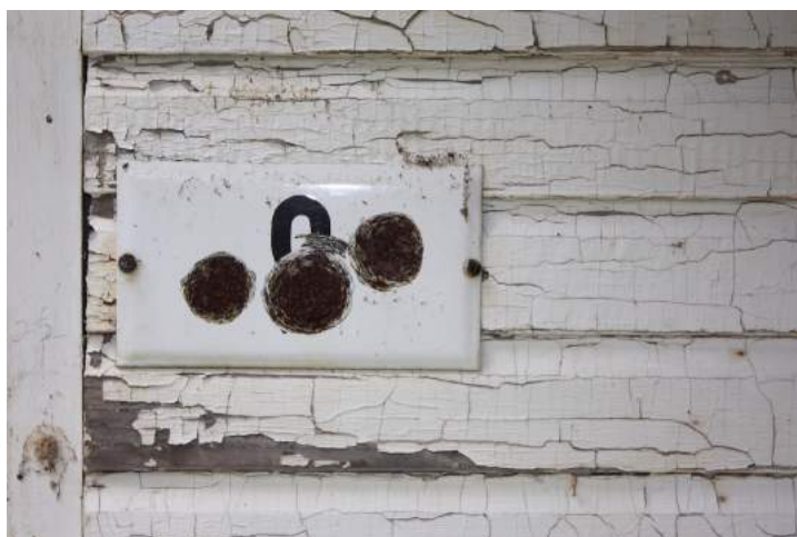
FIGURE 1 : Photographie de Louise Lachapelle

L'article qui suit prend forme depuis les matériaux et l'atelier d'un petit livre en cours de réalisation, Le coin rouge , un essai_maquette sur la création, ses processus, ses objets. Amorcé par un retour sur un corpus de travaux, de relations et d'expériences liés à la maison 1 , ce geste est aussi fait des