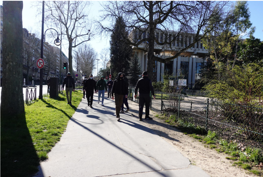
FIGURE 1 – Que peuvent les jeunes qui viennent de lancer des œufs pleins de peinture sur les vitres de l’Ambassade de Russie à Paris ?