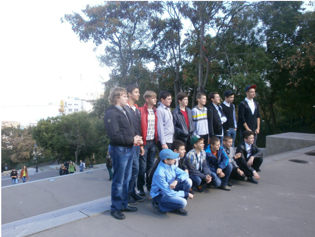
FIGURE 19 – Lycéens posant au sommet du grand escalier d’Odessa.

Je suis bouleversé de penser que les lycéens que j’ai photographié voici près de dix ans devant les marches du fameux escalier d’Odessa (immortalisé par le film d’Eisenstein Le Cuirassé Potemkine en hommage aux révolutionnaires de 1905) sont aujourd’hui sous les drapeaux. Ils meurent pour défendre leur patrie. Héros exemplaires dont le thrène rejoindra les lamentations les plus émouvantes qu’aura connue l’Europe. Voici les mots d’Anna Romanenko, journaliste à Marioupol, recueillis sur internet pour Le Monde par Emmanuel Grynszpan le 5 mars :