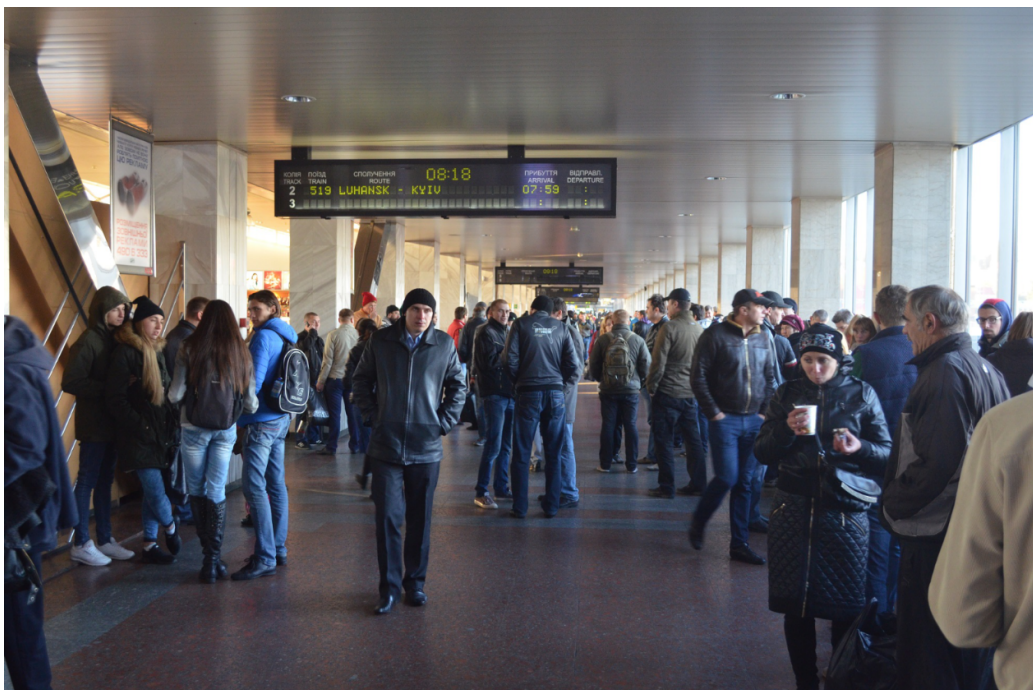
FIGURE 15 – Gare centrale de Kiev : arrivée du train de Louhansk.

Poutine est loin d'avoir gagné – mais sa défaite prendra du temps et laissera l'Ukraine exsangue. Timothy Snyder (2022) le voit pris dans un système de dénégations et de provocations liées à ses illusions manipulatrices et affirme que le despote russe n'a aucun horizon stratégique cohérent. Russia Today banni des moteurs de recherche, le blocage des liaisons aériennes internationales vers la Russie, les transactions financières bloquées, le spectre de la faillite russe est là. Poutine exportera ses stocks pétroliers et agricoles vers la Chine : cela ne se fait pas du jour au lendemain. Peut-il occuper l'Ukraine sans courir au désastre ? Zelensky le sait, cela explique sa manière de faire voir au monde et aux Russes l'énorme forfaiture de Poutine et le patriotisme ukrainien. C'est d'ailleurs le motif de son attitude intransigeante lors de la tentative de médiation esquissée par Emmanuel Macron, qui a certainement tenté de faire pression sur Zelensky pour lui conseiller un moyen d'éviter la guerre après avoir entendu les récriminations de Poutine. Convaincu de l'inutilité de la moindre négociation alors que les Russes étaient déjà en ordre de bataille, Zelensky a demandé l'appui européen quelle que soit la décision