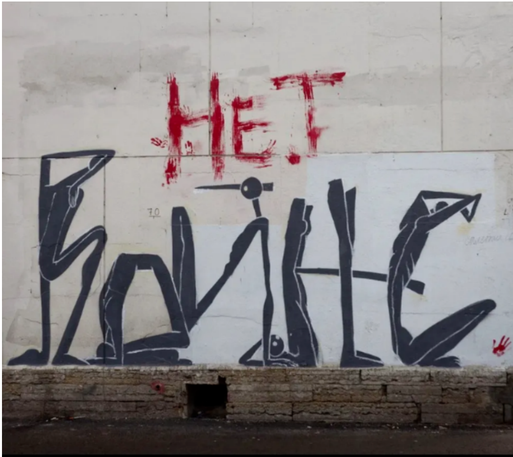
FIGURE 9 – Autre inscription contre la guerre publiée le 2 mars 2022 par le site Meduza.io

Le conflit a été préparé par une propagande honteuse faite de détournements d'images et des caricatures les plus éhontées du pays que l'on se prépare à démanteler. Vu du Nord, l'Ukraine serait un vaste marécage qui sépare les villes de la Baltique d'un débouché impérial vers la Méditerranée : la construction d'Odessa et de Sébastopol au XIX e siècle en seraient les issues. L'humour corrosif de Gogol, né en Ukraine, avait saisi sur le champ que ces projets ne pourraient s'accompagner que d'une bureaucratisation et d'une servitude sans limites.