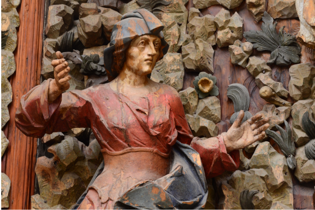
FIGURE 5 – Dans une église de Lviv, fragment d'une Crucifixion – sculpture sur bois.

cet article se veulent le tombeau d'une ouverture au monde que cette guerre meurtrière entend punir. Engager une guerre totale contre une démocratie pacifique qu'on prétend libérer est tout simplement monstrueux. Les présupposés impérialistes et totalitaires qu'elle mobilise font de la Russie de Poutine un Etat-paria qui ne se relèvera pas de cette campagne inique.