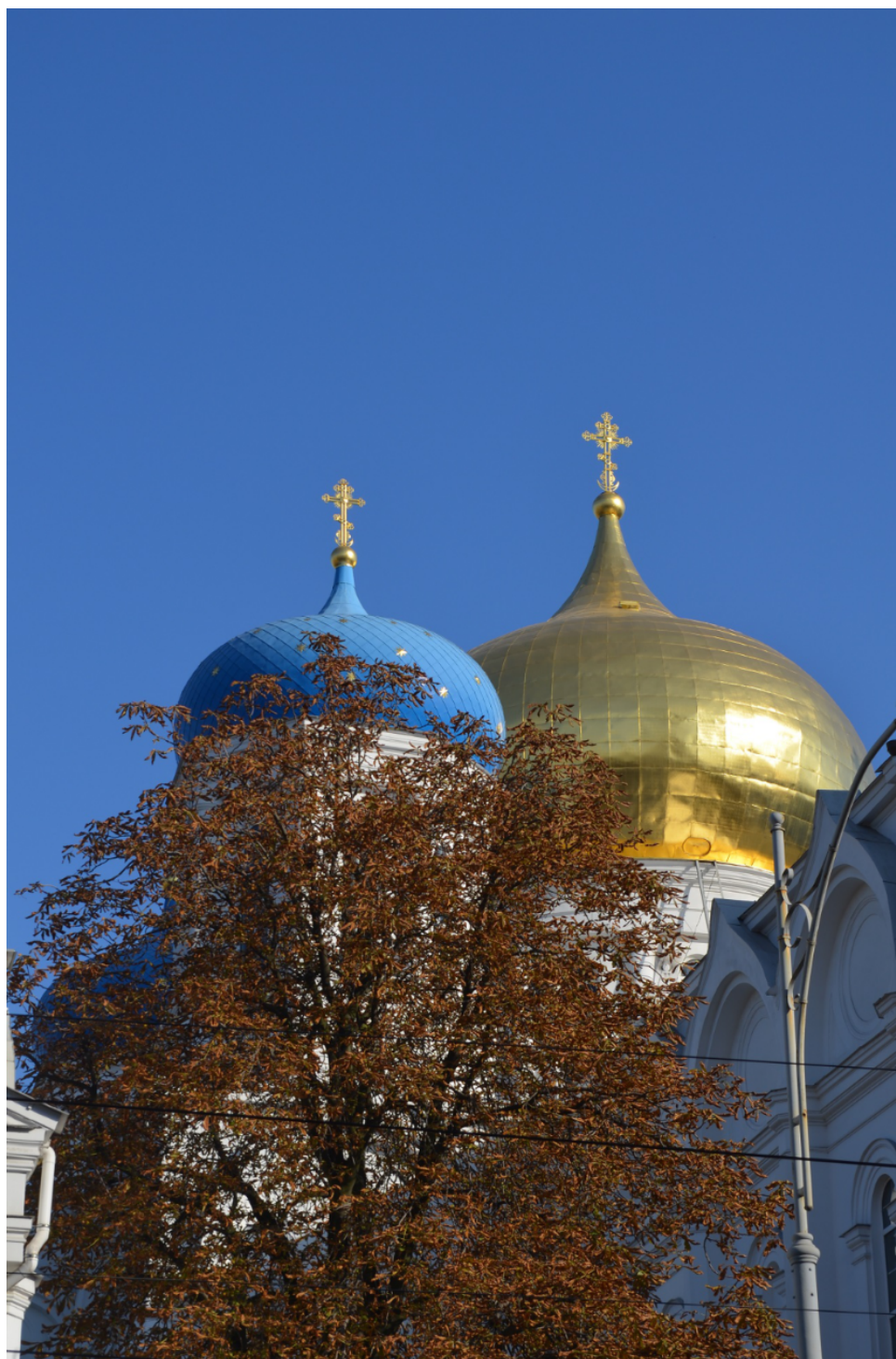
FIGURE 2 – Eglise à Odessa.