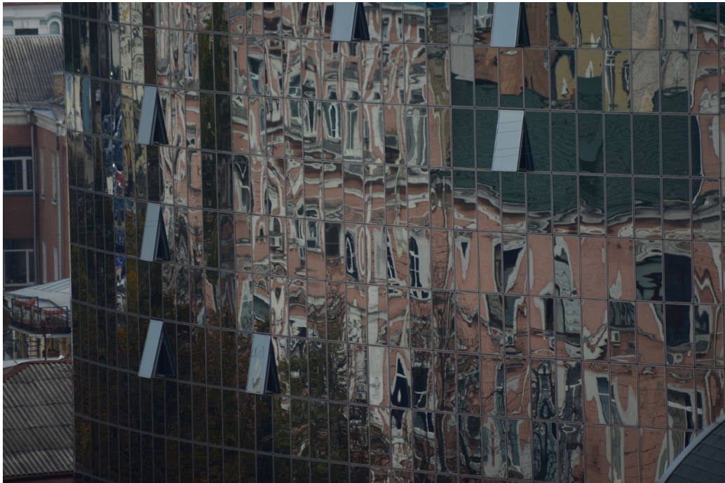
FIGURE 11 – Jeux de lumière sur les façades de Kiev. Photo : Gérard Wormser

Rien de nouveau : la rumeur a toujours accompagné les guerres et la propagande idéologique. Mais la puissance des réseaux couplée aux moteurs de recherche conçus pour sélectionner par itération des résultats convergeant avec des requêtes antérieures garantit que les fermes de trolls encouragent les représentations biaisées ou fausses qui apparaîtront avant des articles mieux documentés, mais plus délicats à charger. La communication de crise en Ukraine ne fait pas exception. La panique y est entretenue par les assaillants, d'où le rôle essentiel de Volodymir Zelensky.