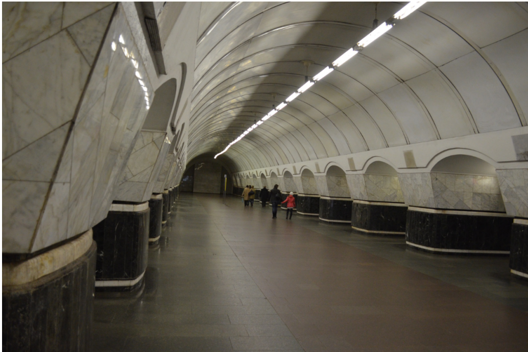
FIGURE 18 – Couloirs du métro de Kiev.

Tôt ou tard, les territoires occupés seront restitués et la souveraineté ukrainienne restaurée. Ce sera une des conditions pour que la Russie sorte de l'isolement où elle s'enfonce. Mais dans quel état l'Ukraine sera-t-elle à ce moment, après avoir vu mourir sa jeunesse, ses cadres partir en exil et vaciller ceux qui restent ? Le 2 mars 2022, le président ukrainien a pu dire des envahisseurs qu' ils ne savent rien de Kiev ni de notre histoire. Mais ils ont l'ordre d'anéantir notre histoire, d'anéantir notre pays et de nous anéantir tous. Des millions de réfugiés et de personnes vivant dans les abris ou vulnérables dans les quartiers bombardés, et par dizaines de milliers des militaires au combat. Ce peuple sera brisé pour deux générations.