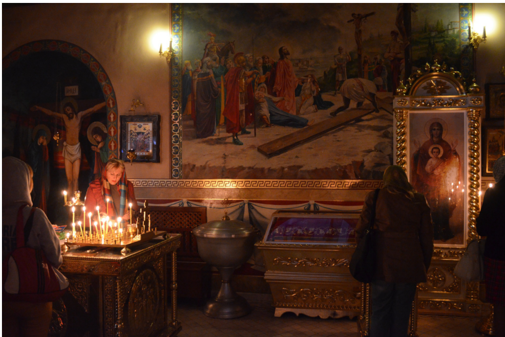
FIGURE 20 – Prière dans une église d'Odessa.

enterrent les morts dans leur jardin. Personne ne compte. C'est un enfer. C'est Alep. Et je voudrais que tout le monde l'entende en Europe. Si vous pensez que ce n'est pas la troisième guerre mondiale, vous vous trompez lourdement. Elle a commencé. Vous faites l'autruche et fermez les yeux et ne soutenez pas la zone d'exclusion aérienne. Parce que vous ne voulez pas de conflit direct avec la Russie, mais ce conflit a déjà commencé. (Grynszpan 2022)