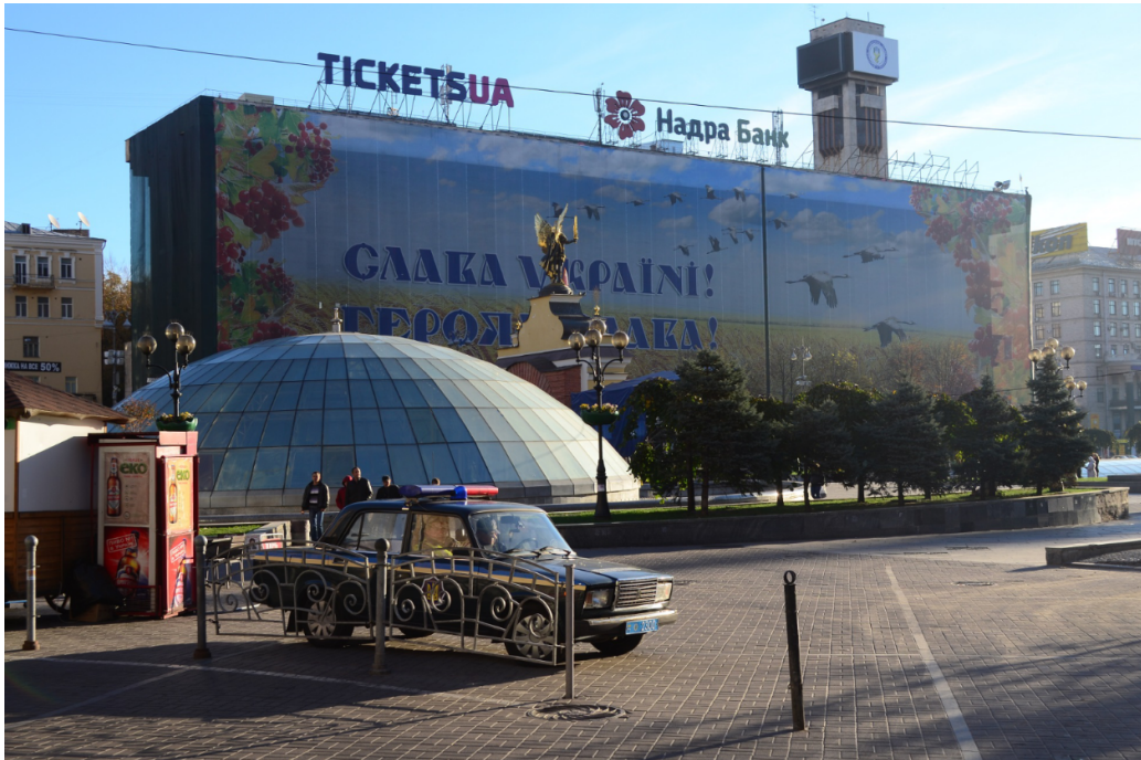
FIGURE 13 – Vive l'Ukraine! : façade de la Place de l'Indépendance à Kiev.

Lancée par Vladimir Poutine, la campagne d'Ukraine de l'armée russe a été précédée d'une intense propagande reprise des stratégies élaborées par Hitler pour soutenir Franco après son putsch contre la République espagnole ou démembrer la Tchécoslovaquie (Snyder 2012), voire de celle utilisée par les Soviétiques pour attaquer la Finlande en 1939 6 .