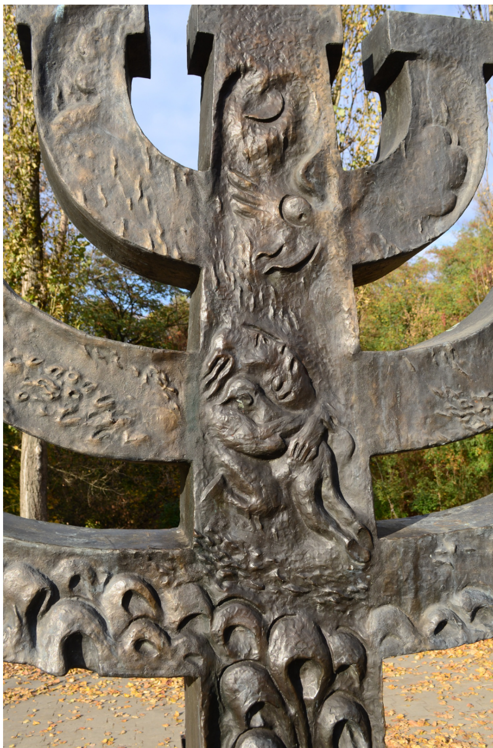
FIGURE 4 – Après la guerre, les dirigeants soviétiques firent silence sur les rafles qui anéantirent les Juifs de Kiev. Il fallut attendre 1991 et le cinquante-nième anniversaire des massacres de Babi Yar pour que soit érigée cette menorah.