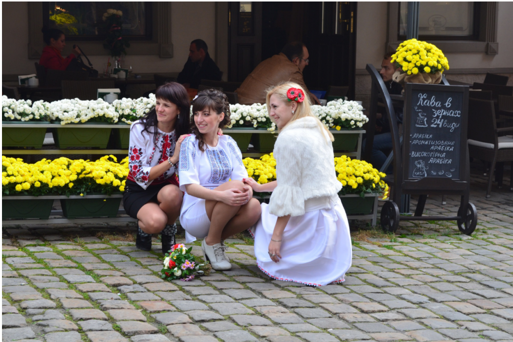
FIGURE 6 – Jeunes filles à Lviv.

Odessa est aujourd'hui tournée vers Istanbul comme vers la Roumanie et la Bulgarie : la ville a résisté en 2014 à une tentative de soulèvement préparé par les Russes. Kiev se souvient de ses liens avec les Grands-duchés de Varsovie et de Lituanie qui dominèrent la région (et la Biélorussie actuelle) jusqu'à la poussée des Moscovites et des Prussiens (qui se partagèrent ces territoires au XVII e siècle, une part revenant aux Habsbourg de Vienne). A quoi bon falsifier cette complexité et la détruire quand toute ville est une collectivité multiculturelle, un lieu d'accueil international ? L'ancre ukrainienne symbolise le cosmopolitisme d'une terre de migrations et de passages entre Baltique et Mer noire. De Kiev et Odessa jusqu'à Kharkiv ou Lviv, les Ukrainiens contribuent à la conversation européenne : pas question de les désintégrer !