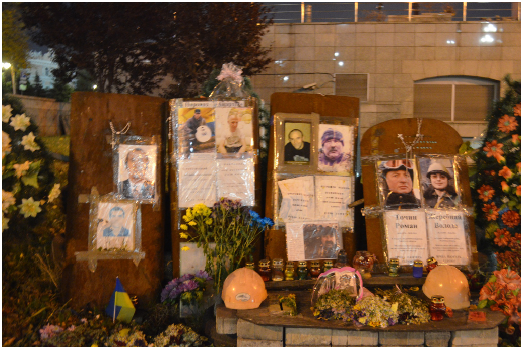
FIGURE 16 – Au mémorial des victimes de la répression de la révolution de 2014 vont succéder des cimetières entiers.

Précipiter le monde dans un désastre qui brise la vie de plusieurs millions de personnes jetées sur les routes, lesquelles auront vu leur ville détruite sous leurs yeux : tandis que le pouvoir russe parle de libérer ces gens d'une tutelle nazie, la réalité est que le métro est l'unique abri sûr dans Kiev, que Kharkiv est détruite tout comme des dizaines de localités, que les troupes russes asphyxient le pays en confisquant ses issues maritimes, ne lui laissant peut-être regrouper sa population rebelle que dans l'ancienne Galicie. Tout est fait pour briser la capacité de résistance des populations. Le tyran russe ne cède à aucune pression. Il veut une victoire militaire totale. Son isolement international complet et la perspective d'une crise majeure en Russie ne l'affecte apparemment pas. Il entre ainsi au panthéon des pires despotes.