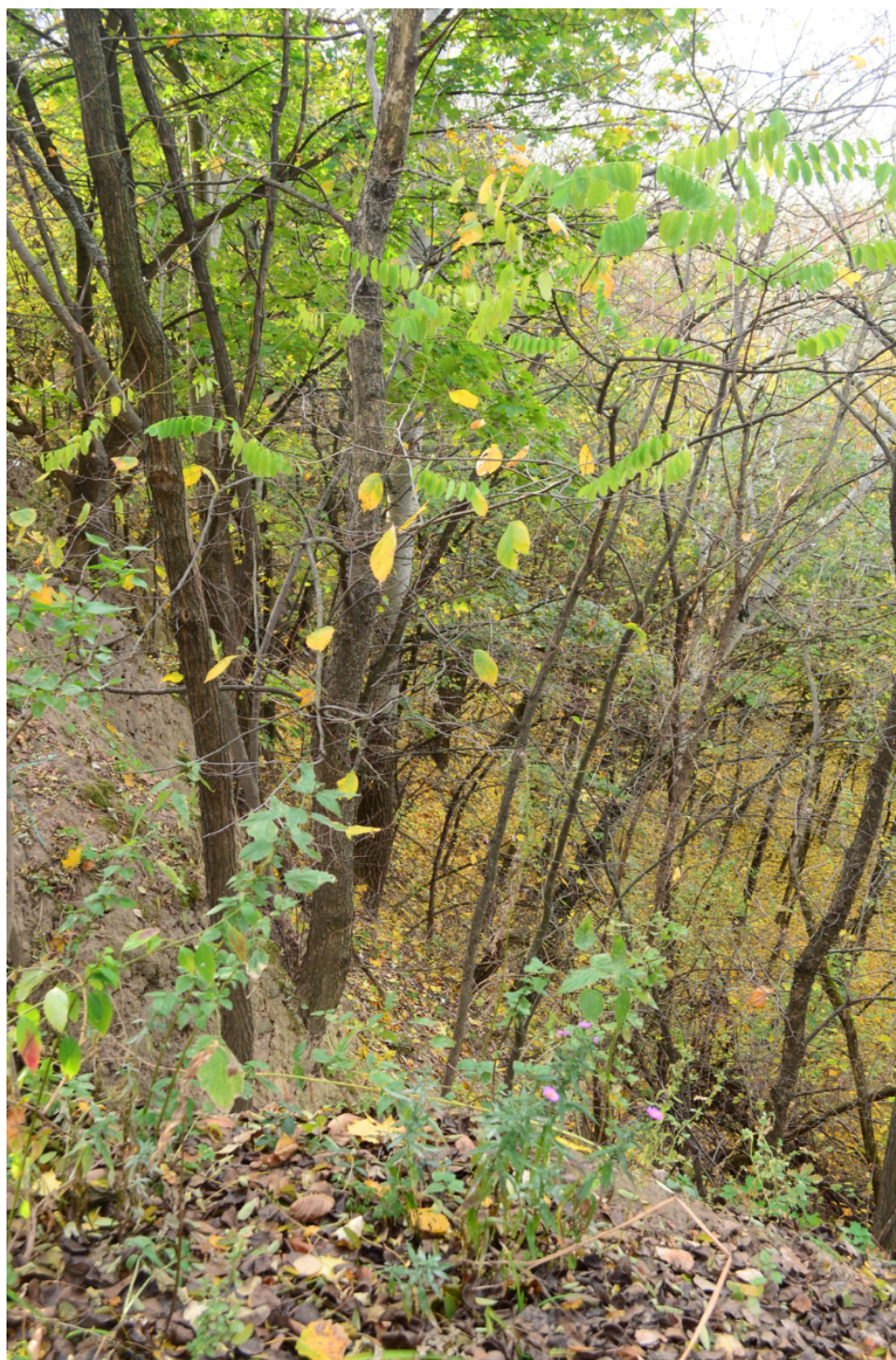
FIGURE 3 – Une partie de ce qui reste du ravin de Babi Yar, où furent assassinés les Juifs de Kiev et bien d'autres victimes du nazisme entre 1941 et 1943. Les exécutions massives de la fin septembre 1941 – 33 000 personnes selon les documents allemands – furent les pires de la « Shoah par balles ».