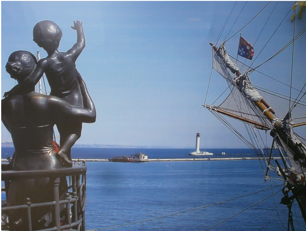
FIGURE 7 – Le port d’Odessa.