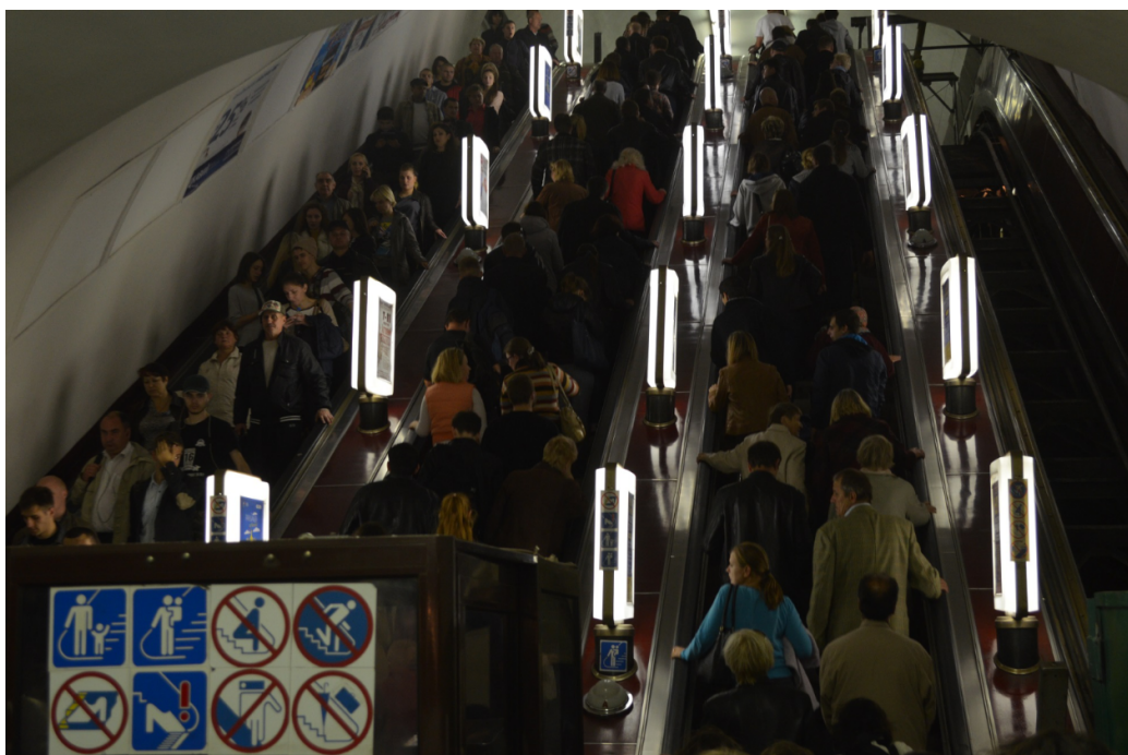
FIGURE 17 – Escalators du métro de Kiev.