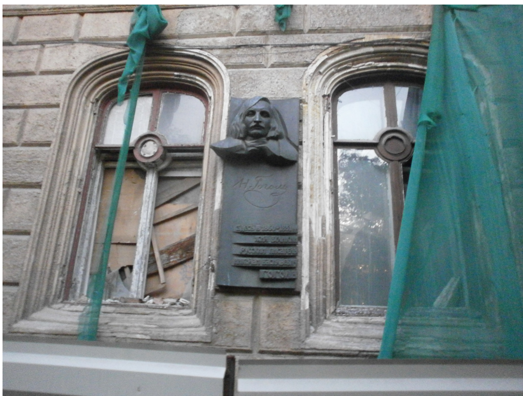
FIGURE 10 – La maison d’Odessa où Nicolas Gogol habitait en 1851.

L'écrivain russe Vladimir Sorokine (2022) rappelle que l'autocratie russe reste sous Poutine celle conçue par Ivan le Terrible : une poigne de fer prête à s'abattre à tout moment sur toute composante du peuple. Comment ce despotisme est-il intact après 500 ans ? C'est un fait. Poutine se débarrasse des opposants ou des oligarques suspects, héritant d'un pouvoir qui, comme une carotte de glace conserve des traces du passé, plonge ses racines par-delà la couche soviétique jusqu'aux temps médiévaux. D'ailleurs, Poutine a réhabilité la figure oubliée d'Ivan Iline au point d'en faire une référence. Cet intellectuel antibolchevique espérait non seulement qu'un dirigeant suprême redresse la Russie à la chute du régime, mais avertissait que « si les périphéries structurées par le léninisme, au lieu de revenir dans la nation, cédaient aux tentations occidentales, la révolution, au lieu de cesser, pourrait bien