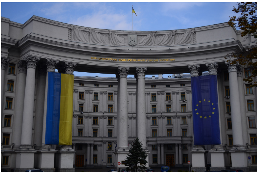
FIGURE 12 – Le drapeau de l'Union européenne flotte sur un ministère ukrainien.