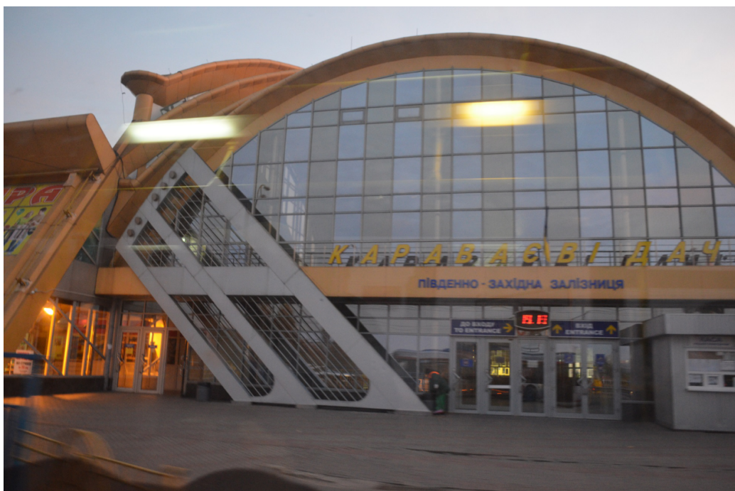
FIGURE 14 – L'une des entrées de la Gare centrale de Kiev.