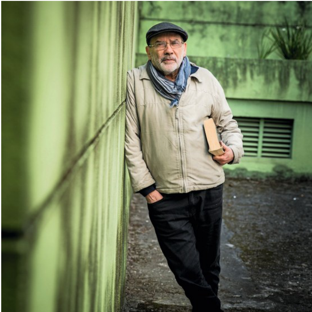
Figura 1: Ruy Fausto

O anúncio do súbito falecimento de Ruy Fausto, ocorrido em Boulogne-Billancourt no dia 1º de maio como consequência de um infarto, foi para nós, assim como para todos os seus numerosos amigos, um choque de uma tristeza infinita. Ruy Fausto foi presença constante em nosso Grupo de Estudo sobre o Neoliberalismo e Alternativas (GENA) e um grande amigo com o qual vivemos tantas belas tardes e alegres momentos tanto em Paris quanto em São Paulo, na companhia de todas aquelas e todos aqueles que o amavam