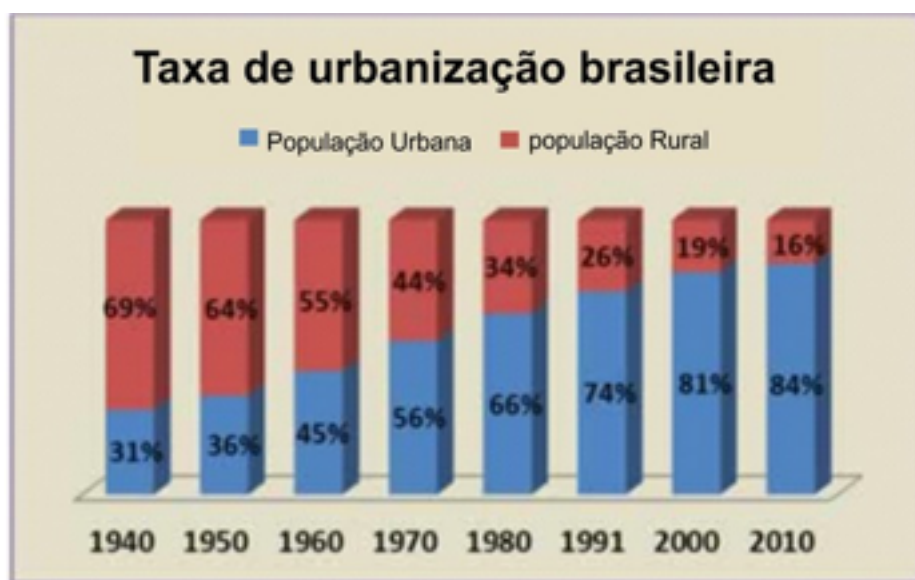
FIGURE 1 – Augmentation de l'urbanisation par décennies.

Ce système de classes né dans les zones rurales a survécu dans les villes, car l'urbanisation et l'industrialisation au Brésil étaient tardives. D'après la Figure 1, on peut affirmer que ce n'est que dans les années 1980 que la population urbaine a largement dépassé la population rurale. Autre question importante : le processus – complexe et non pas linéaire, de l'urbanisation et de l'industrialisation au Brésil est, avant tout, le résultat de l'investissement des propriétaires fonciers et des commerçants, exportateurs et importateurs, des banquiers brésiliens, de l'État, particulièrement à partir des années 1930 et pendant les années 1950, 1960, 1970 et 1980. Bien sûr, l'industrialisation plus récente se fait avec les investissements des groupes financiers internationaux qui s'intéressent à l'économie brésilienne à partir de 1956 avec le gouvernement de Juscelino Kubitschek (1956-1961), ainsi que pendant les gouvernements militaires (1964-1985).